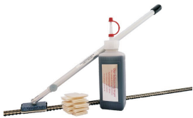
Startsæt kr 368 HO 101 TT 101 N 101