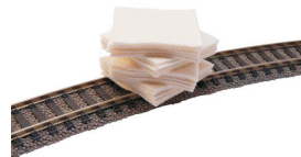
20 rengøringsklude kr. 56,00 HO 104