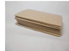
10 stk rensklude til svært beskidte skinner kr. 36,00 HO 107