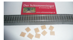
10 stk puder til skinner med midteleder kr. 28,00 HO 111