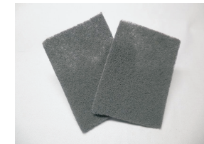
10 stk polerflies svært beskidte metaloverflade kr. 36,00 ikke på lager HO 108