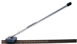
skinnemoppe kr 259,00 HO 100 TT 100 N 100

Man skal dog også huske at rense hjul på det rullende materiel, men også der vil man hurtigt opleve, at tilsmudningen af hjulene nedsættes til takt med skinnerne bliver rene. Samme rensvæske på en klud eller vatpind er godt til hjulrensning. Brug aldrig slibemidler på hjul