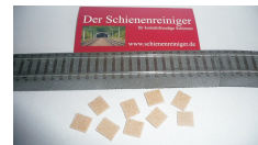
10 stk puder til skinner med midterleder kr. 28,00 HO 111