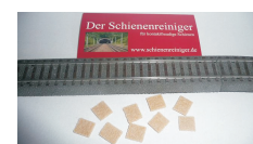
10 stk puder til skinner med midteleder kr. 28,00 H0 111