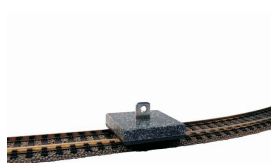
Magnethoved til moppe kr 68,00 H0 103