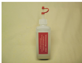
Rensemiddel 250 ml kr 138,00 H0 106