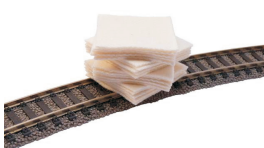
20 rengøringsklude kr. 56,00 H0 104