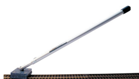
skinnemoppe kr 248,00 H0 100 TT 100 N 100

Man skal dog også huske at rense hjul på det rullende materiel, men også der vil man hurtigt opleve, at tilsmudningen af hjulene nedsættes til takt med skinnerne bliver rene.