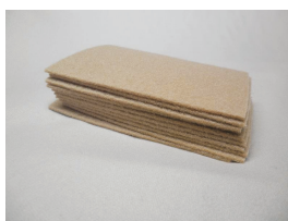
10 stk rensklude til svært beskidte skinner kr. 35,00 H0 107